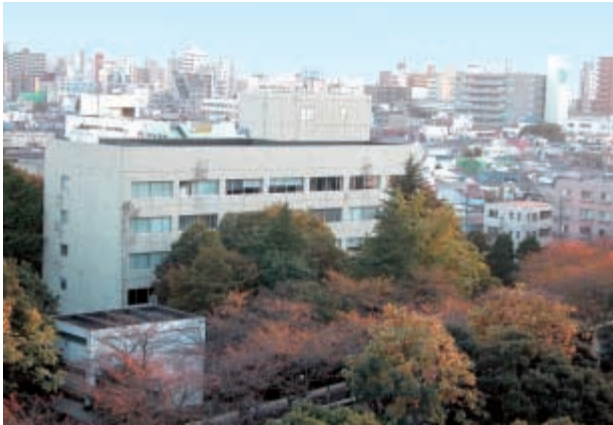
国立国語研究所 1号館及び4号館（左手前） （2003年11月、研究所北東側の国立スポーツ科学センターから）

編集 国立国語研究所普及広報委員会 「国語研の窓」部会 〒115-8620 東京都北区西が丘 3-9-14 電話 03-3900-3111 FAX 03-3906-3530 URL http://www.kokken.go.jp/