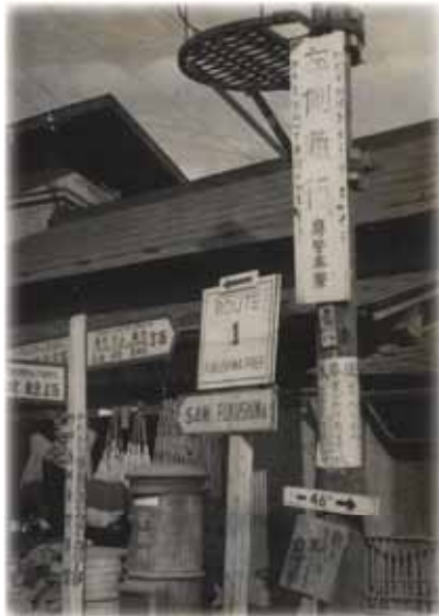
1949年 福島県白河市で撮影

編集 国立国語研究所管理部総務課 普及広報担当グループ 〒190-8561 東京都立川市緑町10-2 電話 042-540-4300 FAX 042-540-4334 URL http://www.kokken.go.jp/