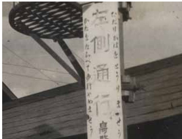
左側通行の看板（表紙写真拡大）

写真には、縦書きの「左側通行」の看板や、英語表記の道路標識などいろいろな看板が写っています。当時は「左側通行」でしたが、1949年（昭和24年）11月の「道路交通取締法」により、「人は右、車は左」という現在のルールになったそうです。「左側通行」の看板をよくみると、「ひだりがは」、「ませう」という旧仮名遣いになっています。アルバムには、調査風景や町並み・馬市の様子など82枚が収められています。台紙や写真の劣化がすすみ、2003年に利用・保存のためにデジタル化と修復をしました。