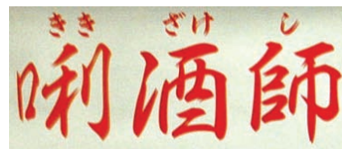
2006年9月東京都立川市内で撮影

さて、北原白秋の第二詩集『思ひ出』（明治44〔1911〕年刊）に、「酒の儼 かび 」と題する詩が収録されています。その一節に、