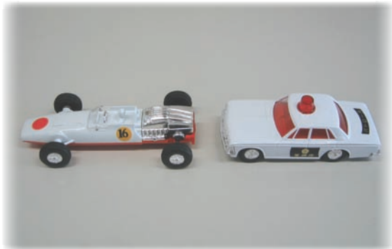
「就学前児童の語彙力調査」で使用したおもちゃ

編集 国立国語研究所管理部総務課 普及広報担当グループ 〒190-8561 東京都立川市緑町10-2 電話 042-540-4300 FAX 042-540-4334 URL http://www.kokken.go.jp/